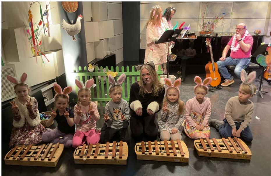
Påskfest med musikleken i Vindängensalen, mars 2026.