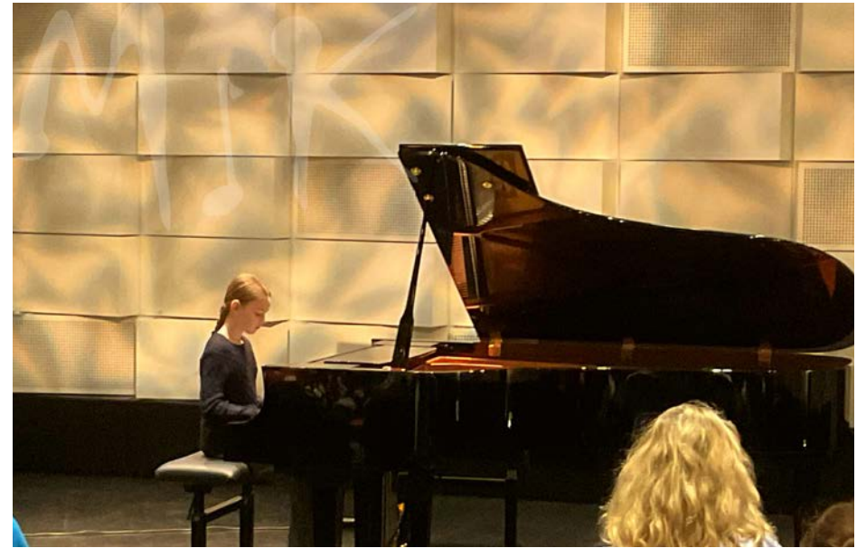
Pianoafton i Vindängensalen, mars 2026.