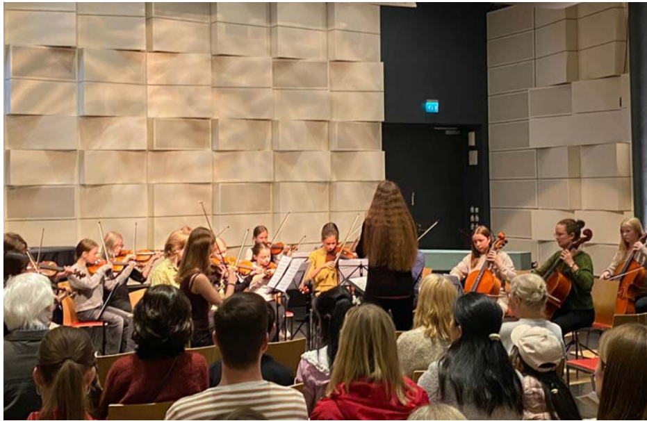
Höstkonsert med Cappella och Stråkvägen i Vindängensalen, oktober 2025.