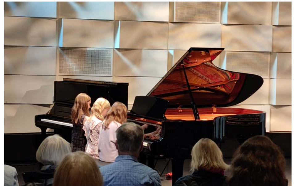
PianoEspoo lunchkonsert i Vindängensalen, september 2025.