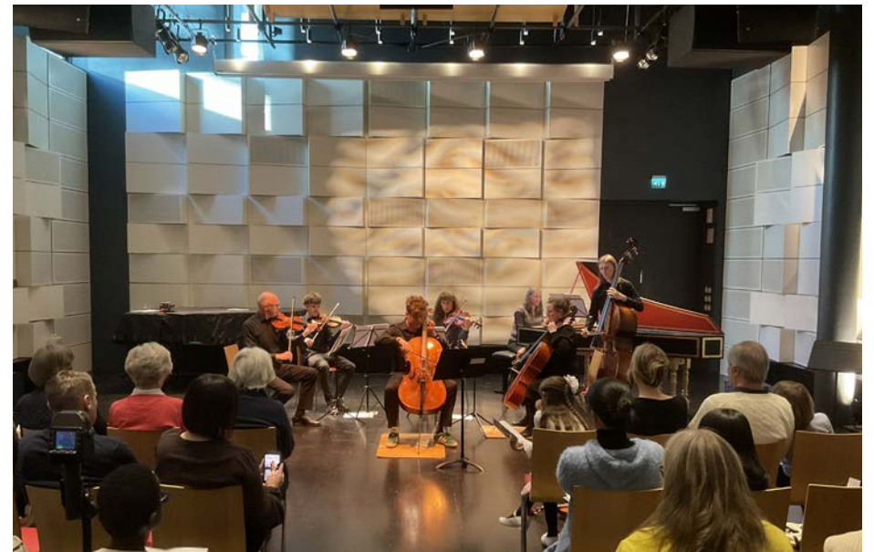
10-års jubilerande Galakonserten i Vindängensalen, maj 2026.