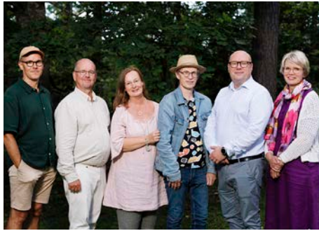
Gitarrkollegiet (och harpa)