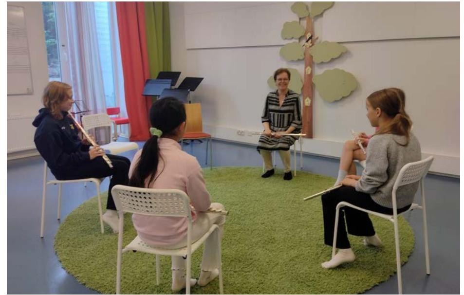
Flöjtisternas improvisationskurs i Vindängen, september 2025.