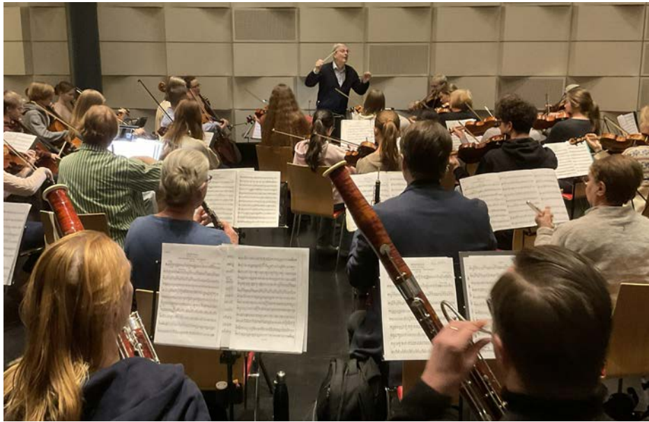
Övning inför TYS - Yhdessä Tillsammans konserten, februari 2026.