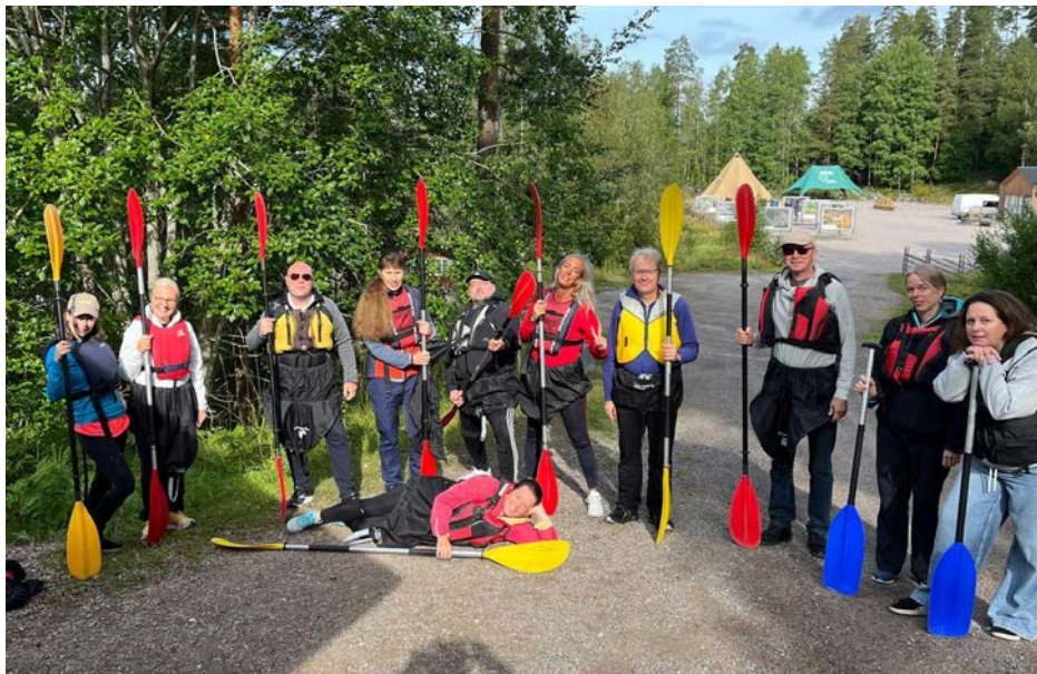
Personalens rekreationsdag på Solvalla, augusti 2025.