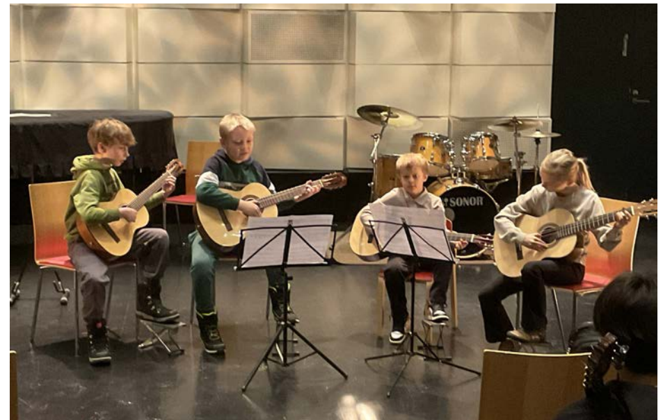
Gitarristernas kammarmusikkonsert i Vindängensalen, februari 2026.