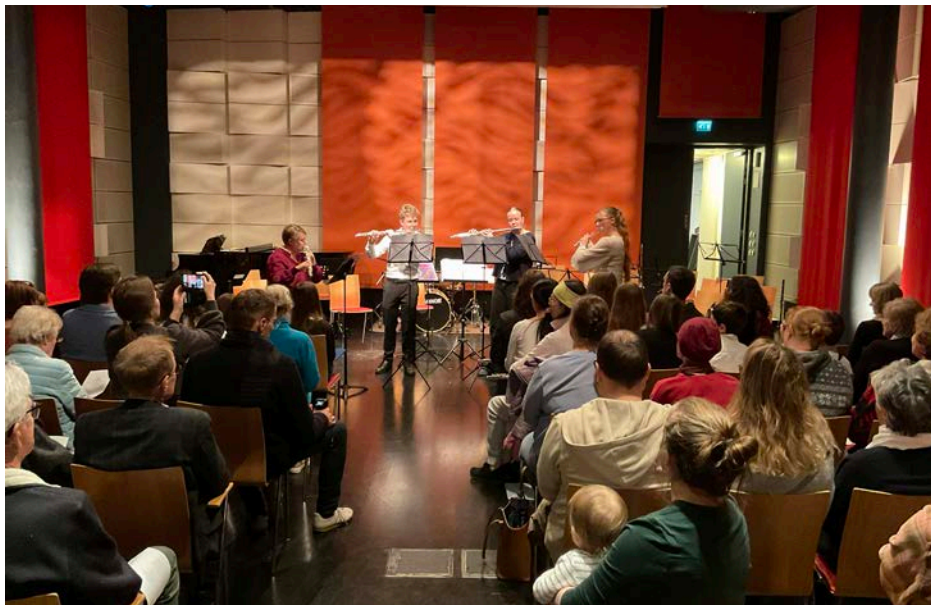
Ljuskonsert med blåsarna i Vindängensalen, november 2025.