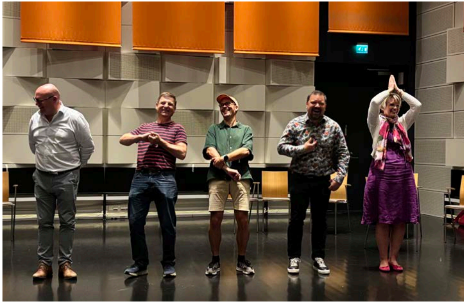
Improvisationsövning på personalens seminariedag i Vindängensalen, augusti 2025.